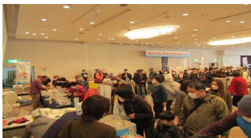
桐生市物産まつり会場風景